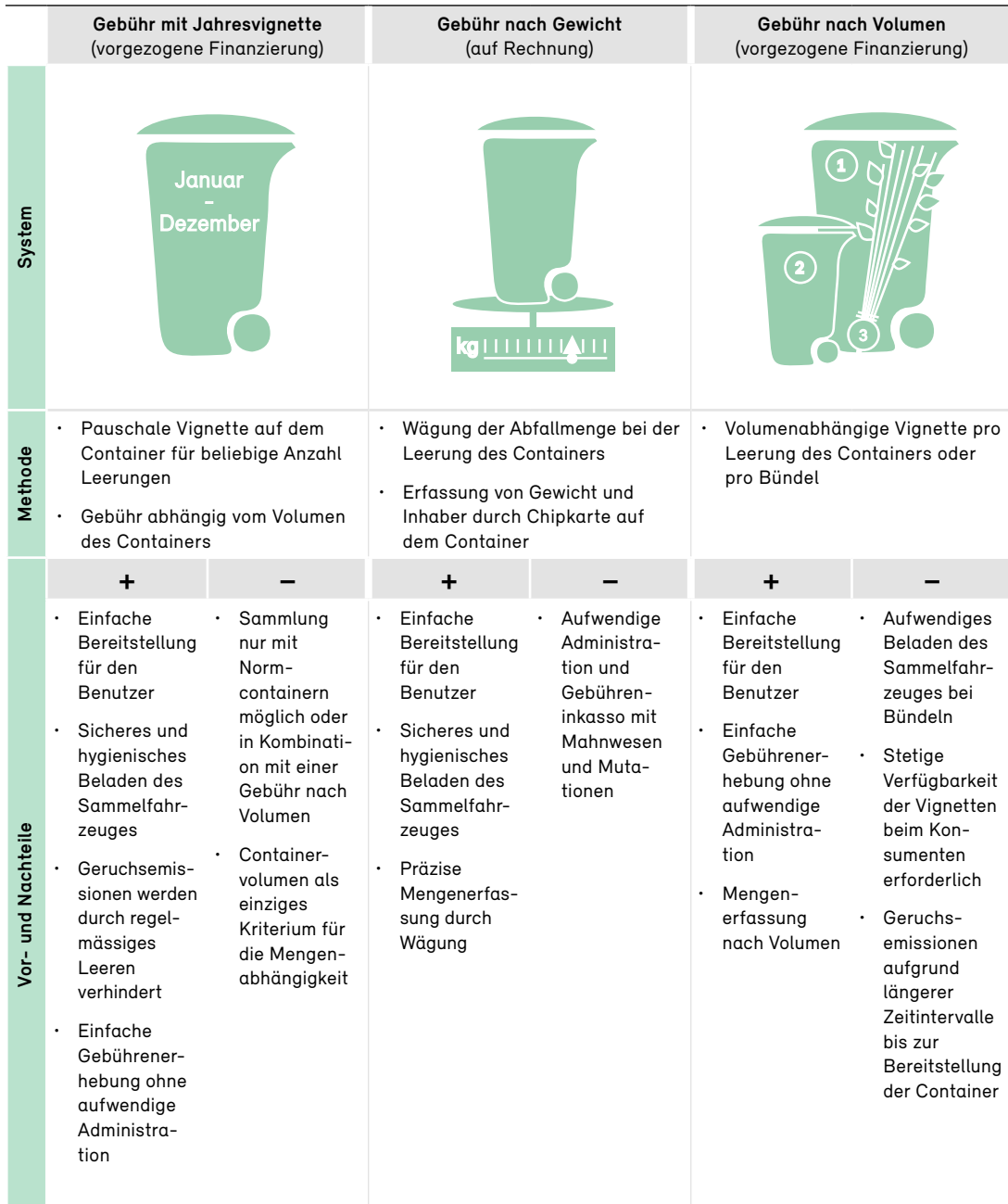
Tabelle 4 Bewährte Entsorgungssysteme für Grünabfälle (Grüngut)