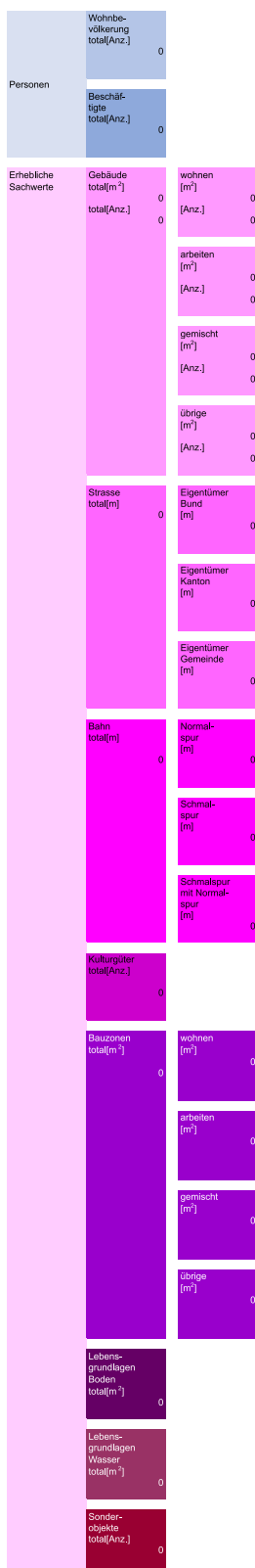
Abbildung 2: Darstellung der Betroffenheit und der Risiken, gezeigt am Beispiel des Hauptprozesses Wasser: senkrechter Teil der Grafik (Schutzgüter und Betroffene)