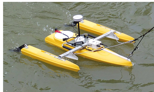
Profileur courantomètre acoustique Doppler monté sur un trimaran.

Les données hydrologiques de l'OFEV ont aussi une utilité tout ordinaire pour la population. Il s'agit par exemple des températures des rivières pour prévoir les baignades en été.