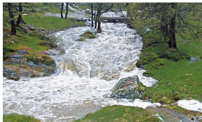
Le Krummbach en crue dans la région du Simplon.

Des mesures systématiques des quantités d'eau sont la condition d'une gestion durable des ressources. Les données acquises fournissent à la Confédération et aux cantons des bases fiables pour évaluer les différentes exigences, que ce soit pour la production d'électricité, la protection de la