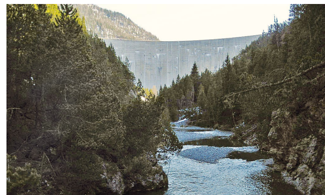
Le débit résiduel du Spöl en aval du barrage de Punt dal Gall.

La navigation, la régulation des lacs et l'utilisation de la force hydraulique sont autant de domaines qui ont besoin de renseignements sur l'état et l'évolution des niveaux d'eau et des débits afin de planifier et organiser les activités économiques. L'OFEV fournit les données complètes aux résolutions spatiales et temporelles requises.