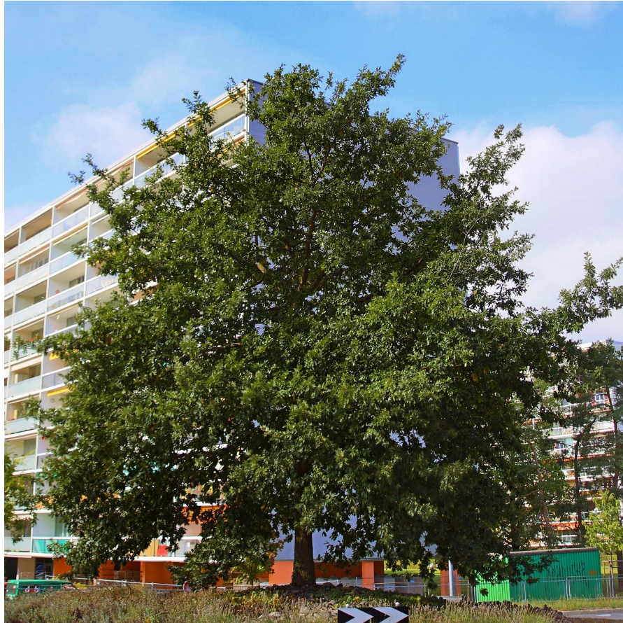
Zerreiche ( Quercus cerris )