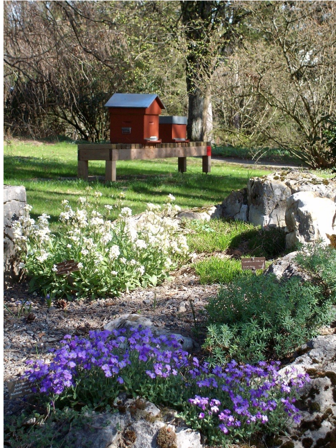
Bienenstöcke und blühende Steingärten