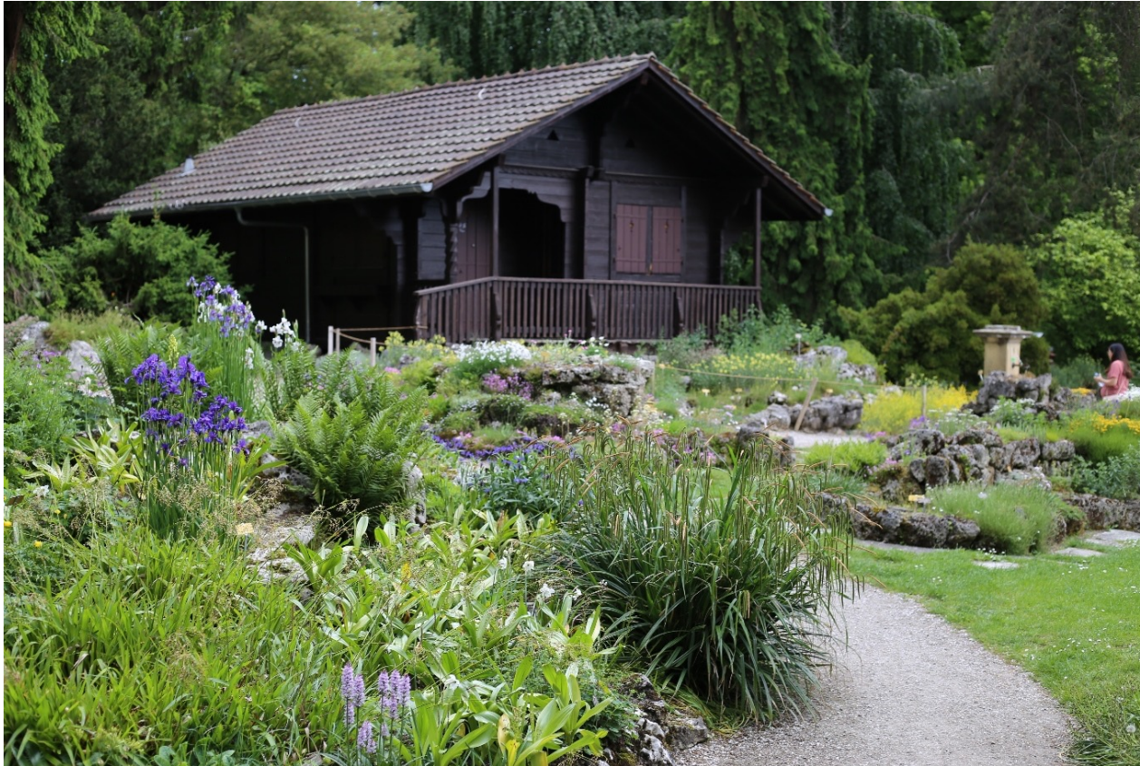
Hütte und Alpenpflanzen-Sammlungen