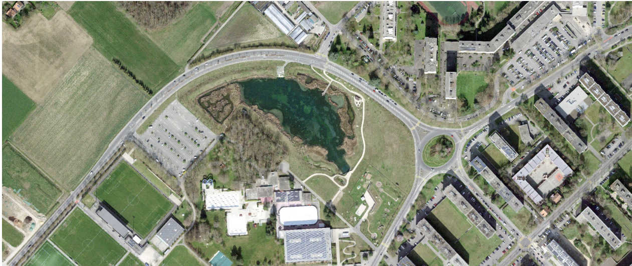
Luftansicht Lac des Vernes und Meyrin