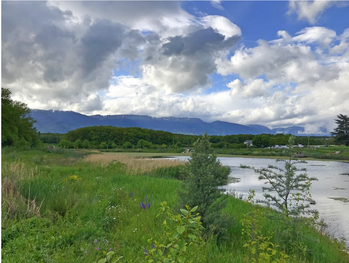
Heimische Sträucher im Uferbereich des Lac des Vernes