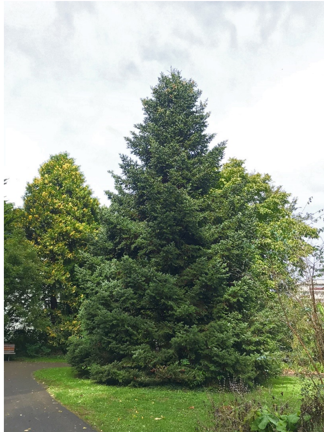
Griechische Tanne ( Abies cephalonica )