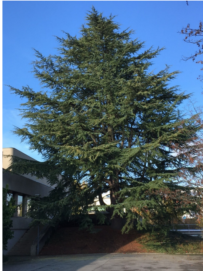
Himalayazeder ( Cedrus deodara )