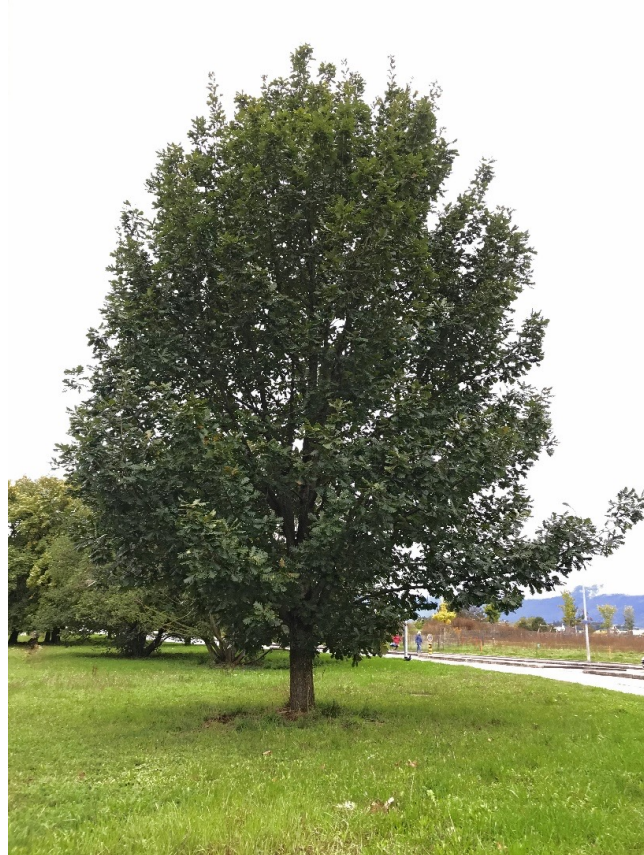
Ungarische Eiche ( Quercus frainetto )