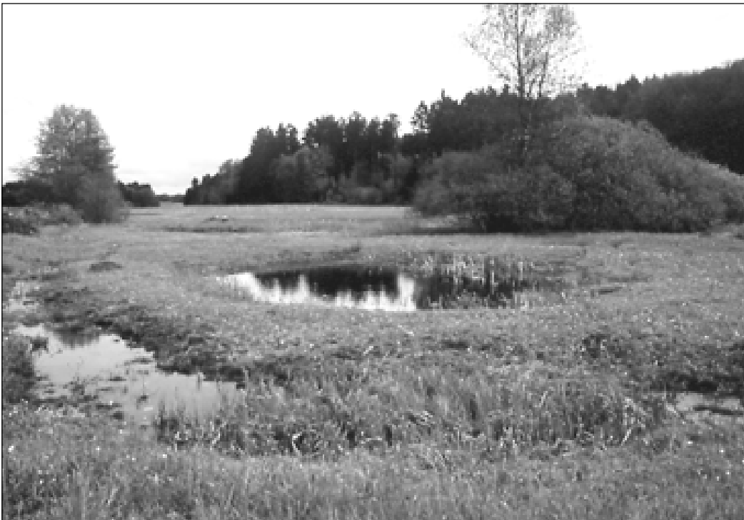
Die Aufteilung der Wasserflächen auf mehrere Tümpel und Weiher erhöht die Vielfalt des Laichplatzangebotes.

Strukturvielfalt im Gewässer, besser aber das Angebot mehrerer verschiedenartiger Gewässer, ermöglicht es den unterschiedlichen Arten, die ihnen zusagenden optimalen Bedingungen vorzufinden. Verschiedene Sukzessionsstadien können zeitgleich nebeneinander existieren. Sind mehrere Laichgewässer vorhanden, sinkt auch das Risiko, durch Austrocknung, Krankheiten