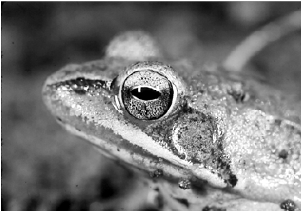
Der Springfrosch findet sich in der Westschweiz, Nordostschweiz und im Tessin. Er lebt in lichten Laubwäldern und laicht in besonnten Waldweihern und Flachmooren.

Aufenthaltsgebiete von jungen Wasserfröschen genutzt, welche sich von den Adulten räumlich abzusondern suchen. Viele Lebensräume, insbesondere jene von Teichmolch, Kammolch und Springfrosch, sind von grossem naturschützerischem Wert. Bei pflegerischen Eingriffen ist deshalb besondere Sorgfalt zur Schonung des gesamten Artenspektrums von Tieren und Pflanzen geboten. Die Landlebensräume umfassen im Idealfall Auenwälder