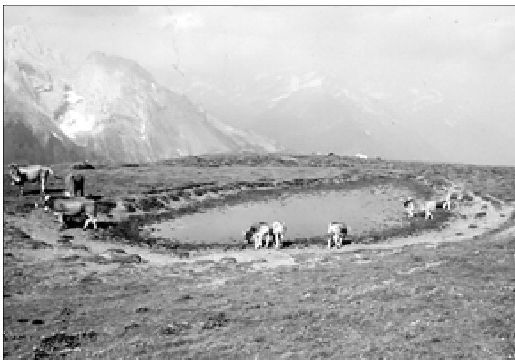
Wenn die Laichgewässer durch Weidenutzung stark beeinträchtigt werden wie in diesem Beispiel, sollten sie zumindest teilweise abgezäunt werden.

ser und Feuchtbereiche, wo sich Amphibien bevorzugt aufhalten, ist schon aus militärischen Sicherheitsgründen verboten. Wo durch den Einsatz von Explosivwaffen neue Kleingewässer entstehen und die militärische Nutzung unter Abwägung mit den Naturschutzinteressen sinnvoll ist, ist der Einsatz auf Zeiten ausserhalb der Fortpflanzungsperiode der Amphibien zu beschränken. Amphibienfallen in Form von Schützengräben, Übungsbauten etc. sind durch Ausstiegsmöglichkeiten zu entschärfen.