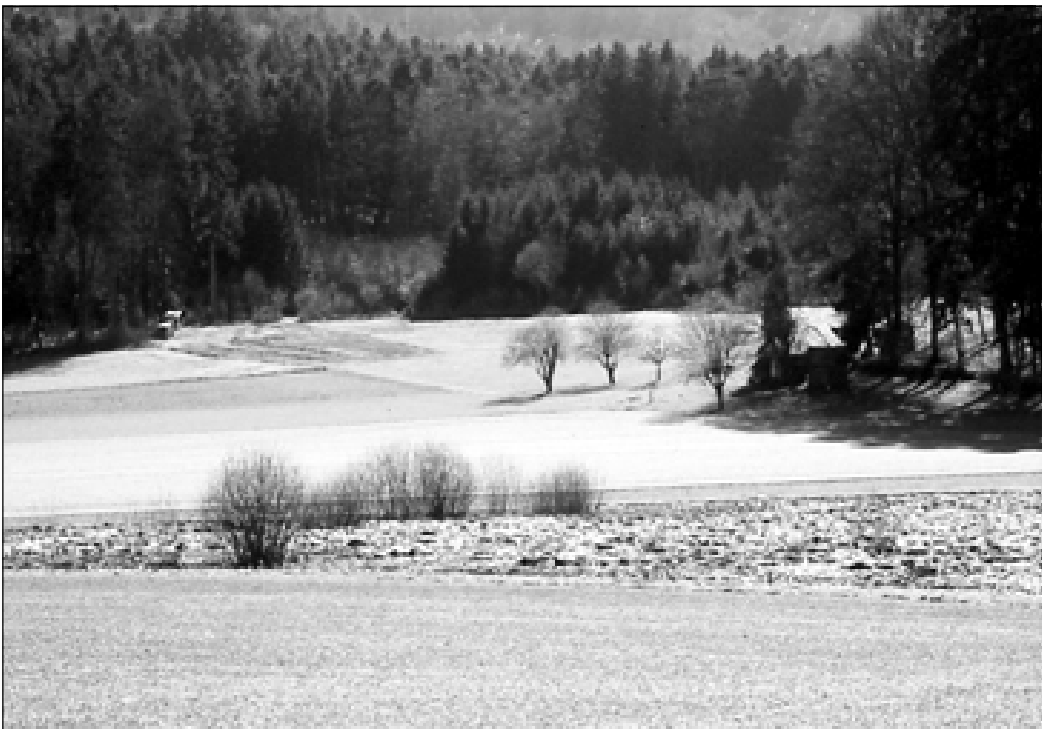
Um die Kernbereiche mit Gewässern und Feuchtgebieten vor schädlichen Einflüssen zu schützen, aber auch um laichplatznahen Landlebensraum zu schaffen, braucht es eine extensiv genutzte Umgebungszone. Bei diesem Flachmoor und IANB-Objekt fehlt sie noch.

räumlich verschoben werden können, d.h. vor allem aktive Kies- und Lehmgruben sowie Steinbrüche. Sie sind im Anhang 2 der Amphibienlaichgebiete-Verordnung aufgeführt. Da diese Abbaugelände räumlichen Veränderungen und Verschiebungen unterworfen sind, ist es nicht sinnvoll, bereits auf Verordnungsstufe Schutzzonen festzulegen. Die Wanderobjekte sind deshalb nicht durch einen Perimeter umschrieben. Dieser ist im Rahmen des Vollzugs durch die Kantone festzulegen, wobei auch bestehende Schutzge-