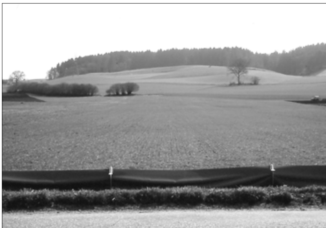
Der Wanderweg der Amphibien, hier vom Wald im Hintergrund zur mit Fangzaun gesicherten Strasse, sollte mit Elementen des ökologischen Ausgleichs wie Hecken, Gräben und extensiven Wiesen aufgewertet werden. Diese bieten Rückzugsmöglichkeiten und vermindern die Verluste während der Wanderungen.

Um eine gefahrlose Wanderung sicherzustellen, sollten die Landschaftsräume einerseits möglichst hindernisarm sein, andererseits genügend Versteckmöglichkeiten zum Überdauern des Tages aufweisen. Ab-