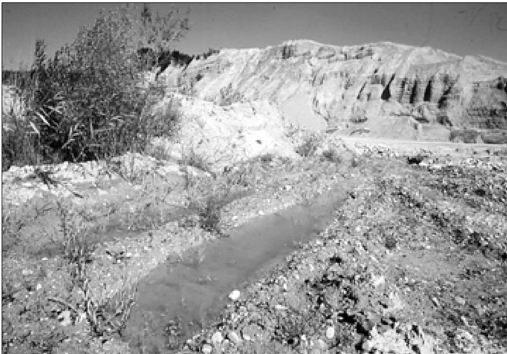
Frühe Sukzessionsstadien und temporäre Gewässer sind die Voraussetzung für eine erfolgreiche Fortpflanzung von spezialisierten Pionierarten unter den Amphibien.

sein, weshalb sich einige Amphibienarten auf frisch entstandene oder temporäre Gewässer spezialisiert haben. Dies gilt vor allem für Kreuzkröte, Unke und Laubfrosch. Alte Gewässer können noch weitere, für bestimmte Arten nachteilige Eigenschaften aufweisen, wie Verschlammung des Bodens oder zu starken Bewuchs. In Ermangelung einer natürlichen Flussdynamik entstehen frühe Sukzessionsstadien in der