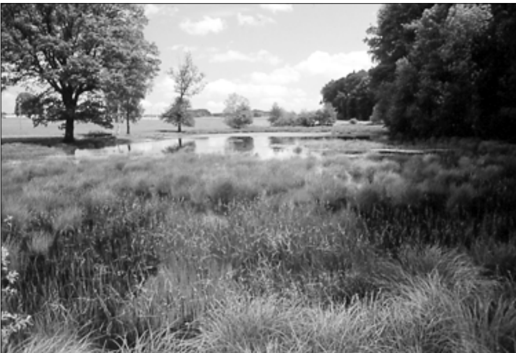
Mit dem IANB sollen die wertvollsten Amphibienlaichgebiete bezeichnet und die Grundlage für die langfristige Erhaltung der Amphibienbestände gelegt werden.

behandlungsmittele) bei. Auch flächenmässig oder qualitativ ungenügende Lebensräume (günstig sind naturnahe Wälder, Hecken, Feuchtgebiete, Bachufer, Ruderalflächen etc.) können das Vorkommen der Amphibien begrenzen oder in besonderen Fällen gar ausschliessen. Dies gilt aufgrund ihrer speziellen Ansprüche besonders für die Kreuzkröte und die Geburtshelferkröte (Kap. 4.3).