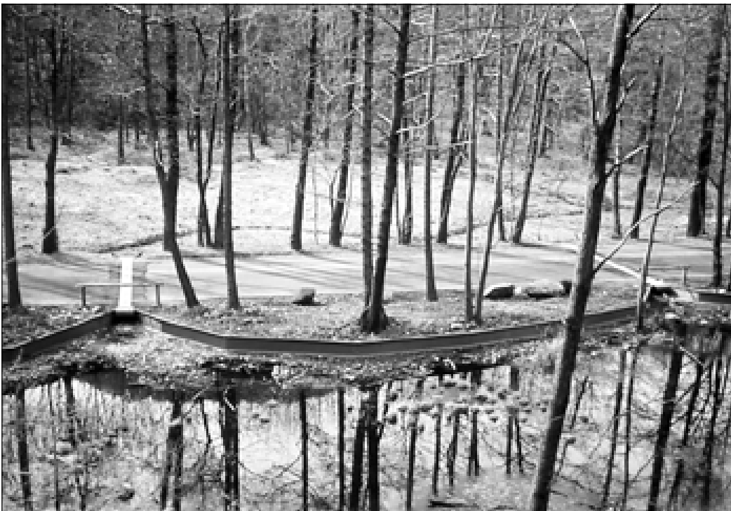
Solide Dauerabschrankungen mit grossen Kleintierdurchlässen bilden eine mögliche Lösung, um den Massentod wandernder Amphibien auf der Strasse zu verhindern.

Wenn stark befahrene Verkehrswege die Wanderrouen von Amphibien kreuzen, gibt es zur Populationsicherung grundsätzlich zwei Möglichkeiten: Durch techni-