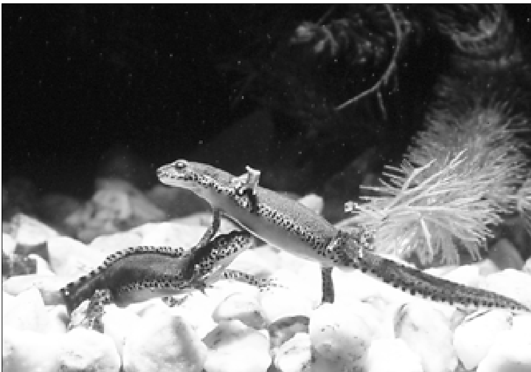
Der Bergmolch mit seinem auffälligen orangen Bauch ist der häufigste Molch in der Schweiz.

aufweisen, während Wasserpflanzen als Deckung für Laubfroschlarven sogar von Vorteil sind. Unke und Laubfrosch bevorzugen eine Bodenschicht aus Lehm oder Schlamm, während Kreuzkröten auch Gewässer mit reinen Kiesböden nutzen. Um eine schnelle Entwicklung der Larven in diesen austrocknungsgefährdeten Wasserstellen zu ermöglichen, ist eine starke Erwärmung und damit eine gute Besonnung wichtig. Ein Durchfluss ist