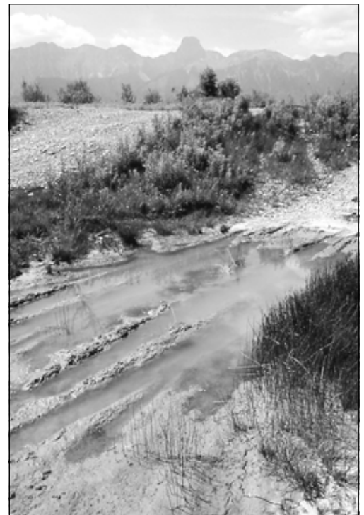
Die militärische Nutzung hilft vielerorts mit, wertvolle Amphibienlaichgebiete, namentlich mit frühen Sukzessionsstadien, zu erhalten.

von konkrete Schutzmassnahmen abzuleiten.