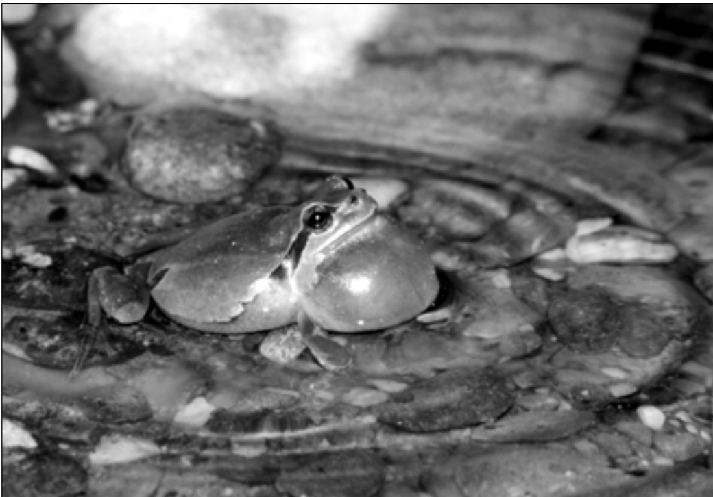
Die Rufaktivität von Amphibien (Bild: Laubfrosch) erleichtert Bestandsschätzungen stark.

Ziel des Inventares ist es, durch die Sicherung des wichtigsten Teillebensraumes der Amphibien langfristig überlebensfähige Populationen zu erhalten. Das Mass für den Erfolg aller Massnahmen sind