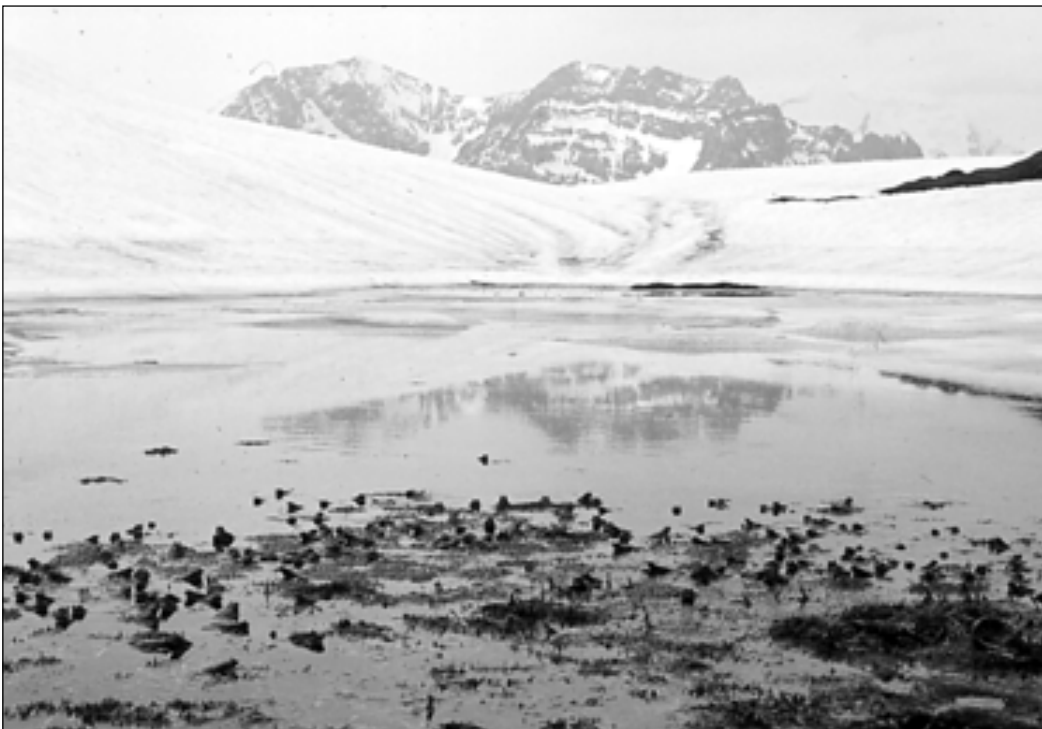
Um Bestandesschwankungen überstehen zu können und langfristig zu überleben, brauchen Amphibien-Populationen eine gewisse Mindestgrösse.

Es ist davon auszugehen, dass die nötigen Mindestbestände u.a. von den Fluktuationen der Populationen und diese wiederum von der durchschnittlichen Lebensdauer und den Lebensräumen der Amphibien abhängig sind. Kurzlebige Arten