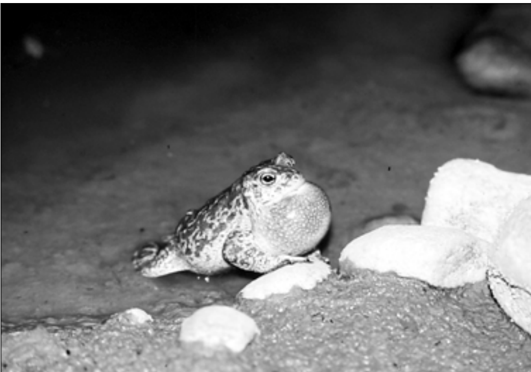
Die Kreuzkröte ist eine ausgesprochene Pionierart und besiedelt heute, nachdem ihre ursprünglichen Laichgebiete durch Flusskorrekturen verschwunden sind, vor allem Kiesgruben.

ende sichergestellt werden, welche anschliessend durch lokale Nutzer schonend abgebaut wird. Voraussetzung zur Erfüllung der Schutzziele ist, dass nach einem Konzept alternierende Flächen genutzt werden. Parallel können Pflegemassnahmen aber weiter nötig bleiben. Die weitere Nutzung einer Grube als Lagerplatz, Kompostierplatz etc. anstelle einer Rekultivierung kann, mit entsprechenden Massnahmen für die Amphibien, ebenfalls