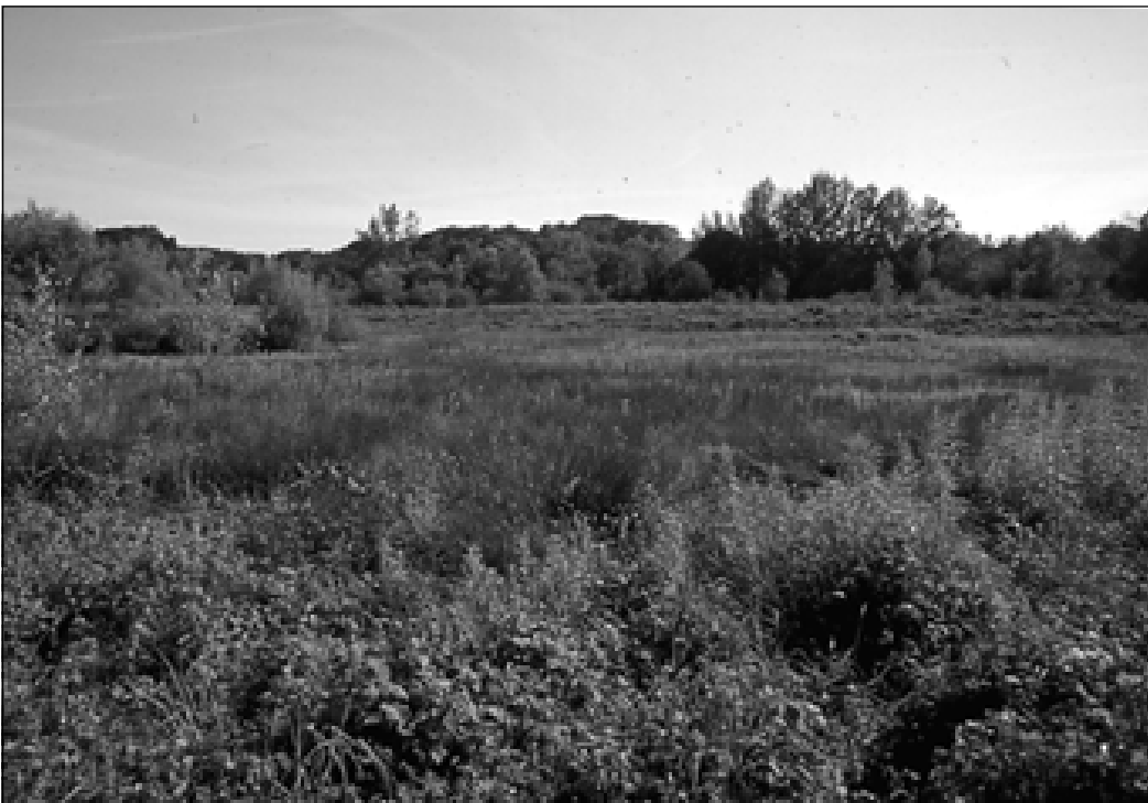
Um einen Nährstoff- und Biozideintrag in die Kernzonen zu vermindern, sind extensiv oder ungenutzte Pufferstreifen notwendig. Sie bilden aber häufig nur einen Teil der Bereiche B, welche auch noch andere Funktionen erfüllen können.

Für die Ausscheidung der Bereiche B sind die Nährstoff-Pufferzonen allerdings lediglich ein Faktor und deshalb als Minimum zu betrachten. Eine Beurteilung der angren-