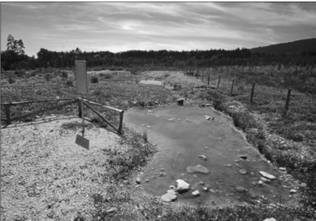
Erschliessung und Erholungsnutzung beeinträchtigen die Amphibien kaum, wenn sie in beschränktem Mass erfolgen bzw. in geordnete Bahnen gelenkt werden.

Eine akute Gefahr für Amphibien stellen elektrifizierte Kunststoffweiden dar, wie sie v.a. bei temporären Weiden für Schafe eingesetzt werden. Kommen Amphibien, aber auch Igel, mit den bis nahe an den Boden reichenden stromführenden Drähten in Berührung, werden sie durch den Stromschlag getötet. Es ist deshalb von grosser Bedeutung, dass solche Zaunsysteme auf Zugrouten vermieden werden bzw. dass Fabrikate gewählt und eine korrekte Installation vorgenommen werden, welche einen genügenden Abstand der stromführenden Drähte vom Boden sicherstellen (s. BVET & BUL 1998).