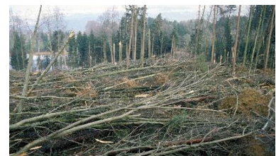
Abb. 3: Geworfener Buchenbestand (Lothar), Bremgarten (AG) (Quelle: Ulrich Wasem, Januar 2000)