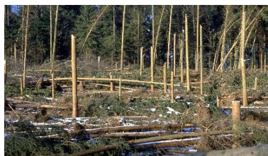
Abb. 2: Umgeworfene und geknickte Fichten (Lothar), Birmensdorf (ZH)