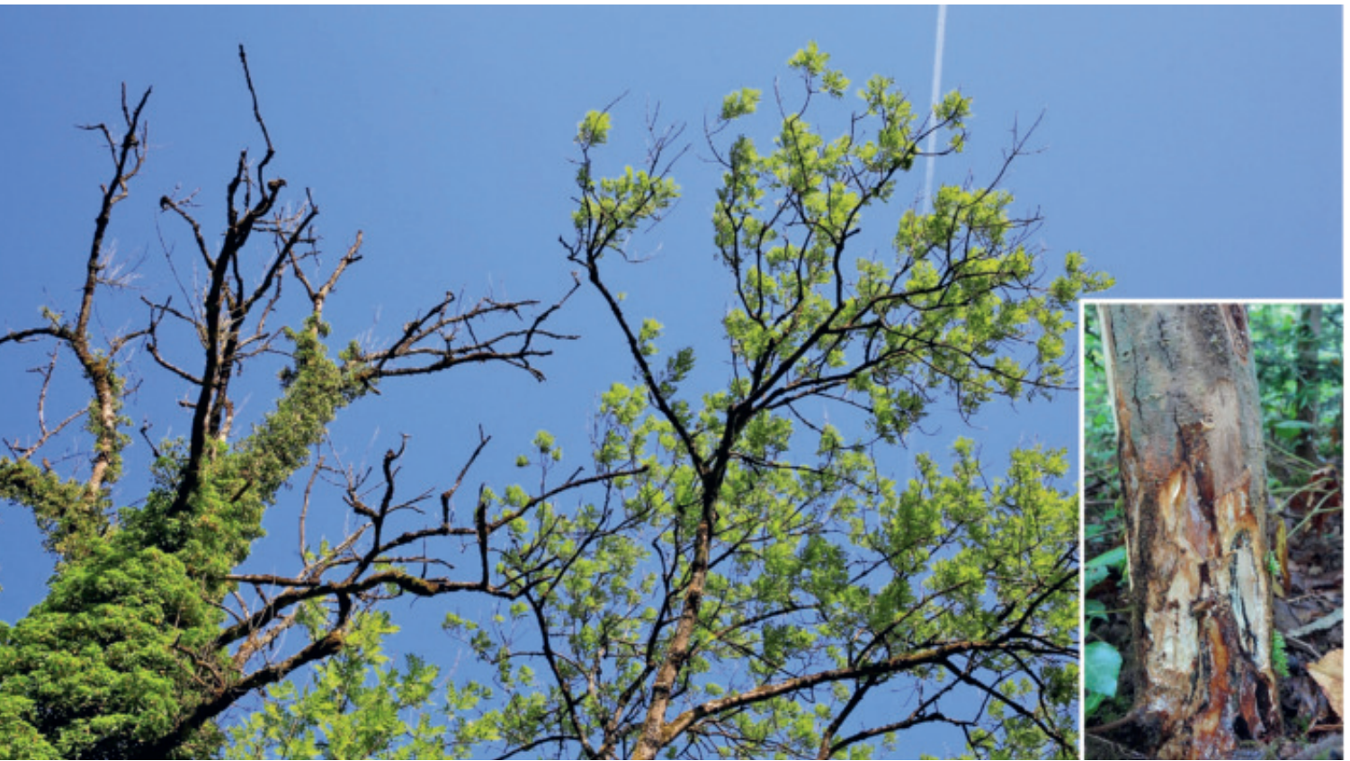
Abbildung 1: Vom Eschentriebsterben befallene Eschen (grosses Bild). Esche mit Hallimaschbefall am Stammfuss (kleines Bild).