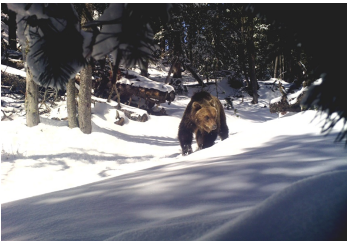
Parc national suisse, 2017

Adopté par le Conseil fédéral lors de sa séance du 27 janvier 2021