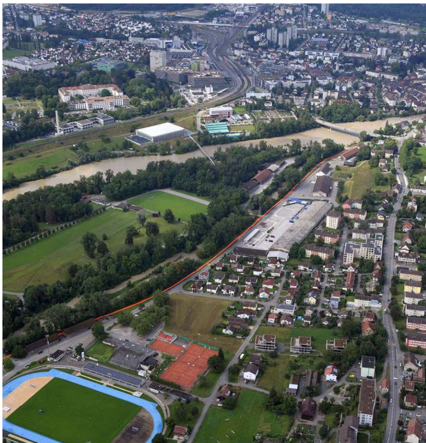
Pour protéger les zones résidentielles des débordements de l'Aar à Brügg (AG) en juillet 2021, les services de protection ont mis en place une digue de boudins Beaver® sur un long tronçon du fleuve (en orange sur la photo).

Malgré la mise en œuvre de mesures de protection, la sécurité ne saurait être garantie de manière absolue le long des cours d'eau et des lacs en cas d'événements climatiques extrêmes. La prise en compte des risques résiduels et la mise en œuvre de mesures organisationnelles permettent cependant de limiter les dommages et de protéger les personnes et les biens matériels de manière efficace.