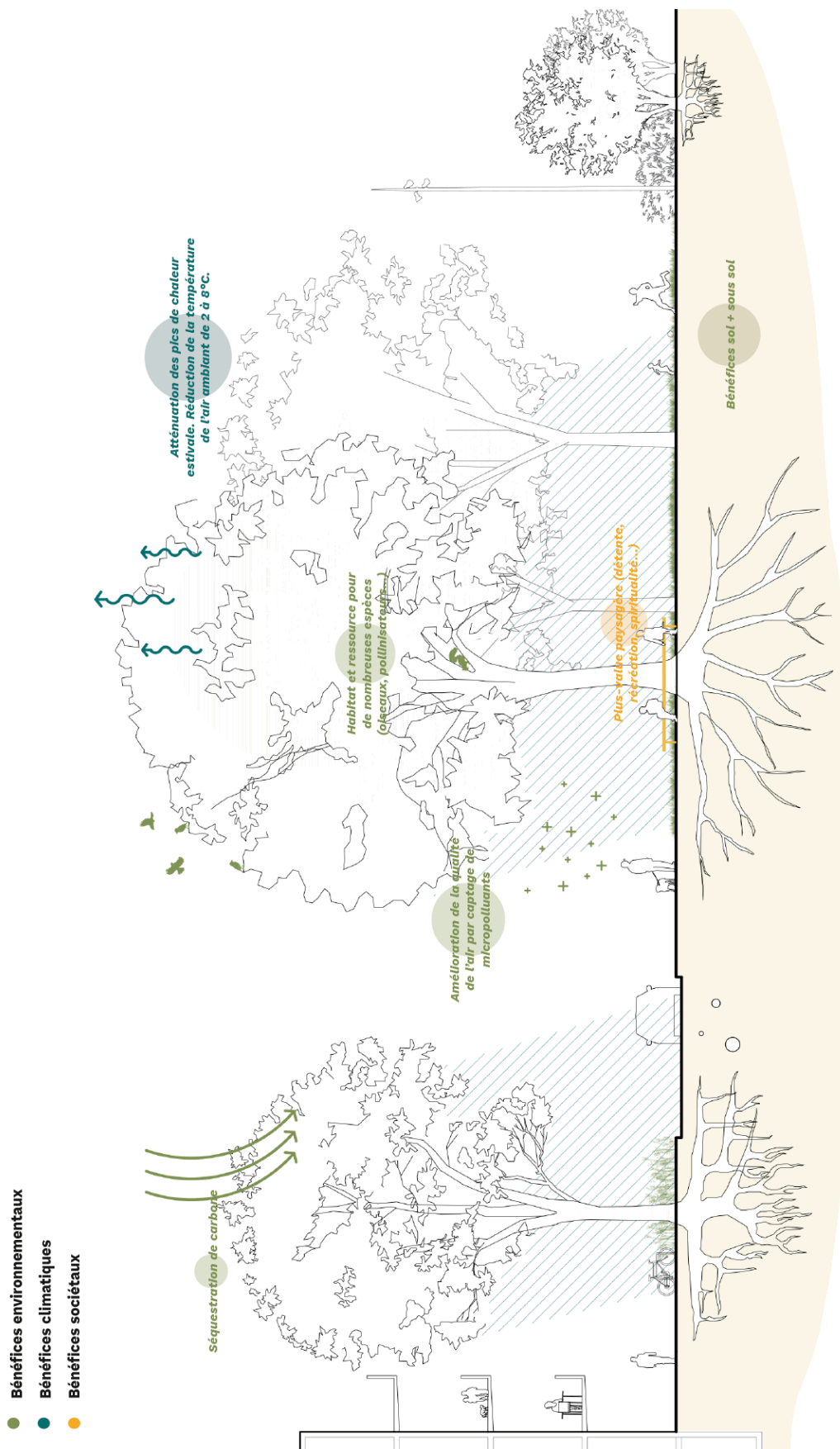
Fig. 4 : Les services écosystémiques de l'arborisation urbaine. Source : Hüsler & associés, n+p (2021).