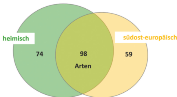
Fig. 3 : Présence d'espèces de taxons dominants sur des groupes d'essences indigènes (heimisch), d'Europe du Sud-Est (südost-europäisch) ou sur les deux groupes d'essences (Böll et al. 2019).

L'étude de Böll et al. (2019) a examiné dans quelle mesure des espèces d'arbres indigènes et exotiques proches influencent la diversité des arthropodes en milieu urbain dans différentes villes de Bavière. Trois paires d'essences différentes (tilleul à petites feuilles/tilleul argenté, frêne commun/frêne à fleurs, charme/houblon) ont été comparées. Toutes les espèces d'arbres présentaient une richesse d'individus et d'espèces inattendue. Un nombre nettement plus élevé d'individus a été capturé sur les essences indigènes, mais pas pour tous les taxons d'arthropodes étudiés. Les espèces d'arbres du sud-est de l'Europe ne se distinguaient en outre pas de leurs espèces indigènes apparentées en termes de diversité d'espèces d'invertébrés. La majorité des espèces ont été trouvées dans les deux groupes d'essences, un tiers uniquement sur les arbres indigènes et un quart exclusivement sur les essences du sud-est de l'Europe (Fig. 1). Comme plus de la moitié des espèces ne se trouvaient que sur l'un des deux groupes d'arbres, la plus grande biodiversité d'arthropodes résulte d'une plantation mixte des essences étudiées.