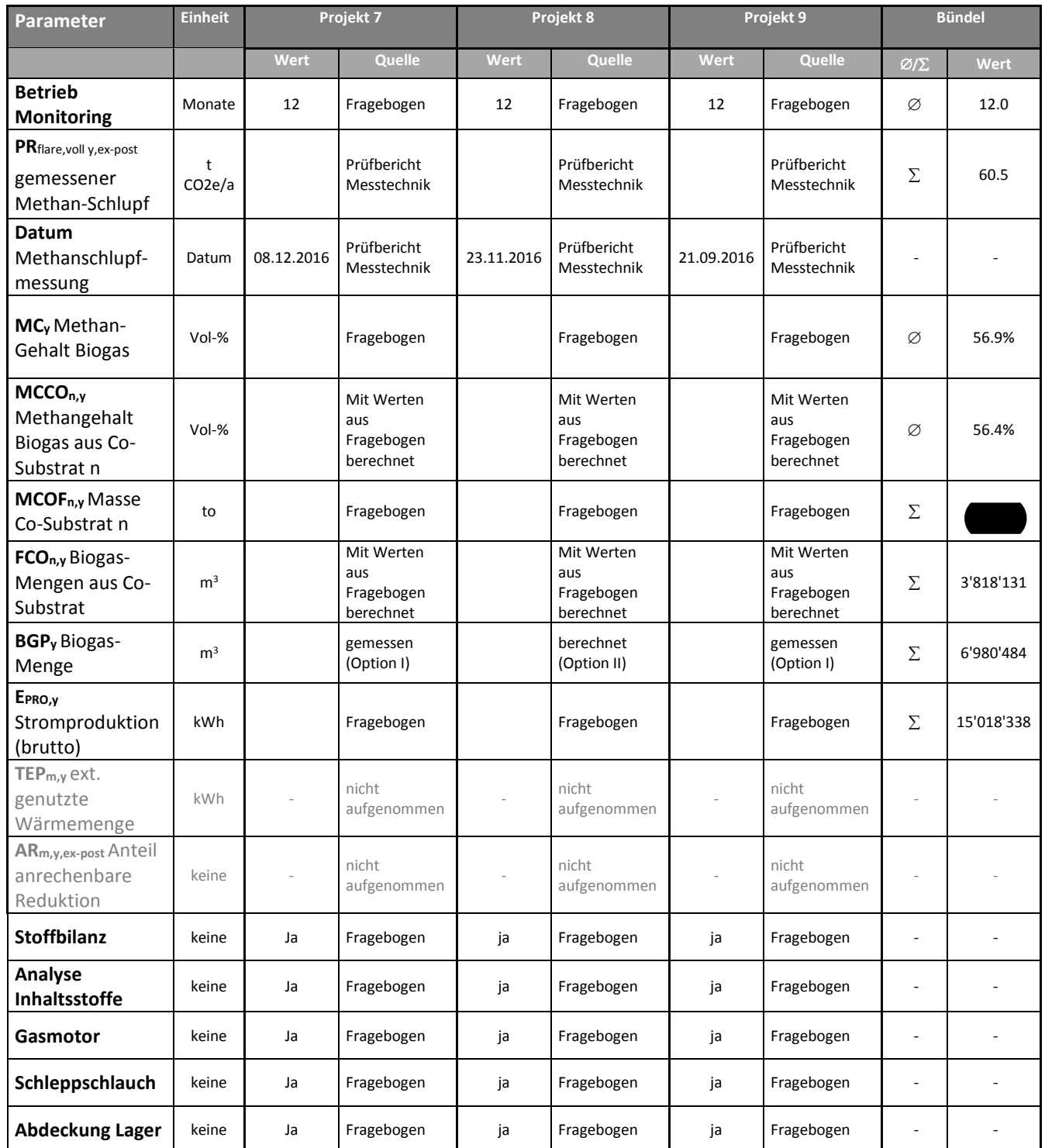
Tabelle 3: Monitoringparameter aller Projekte