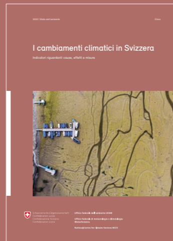
Foto di copertina Siccità sul Lago di Brenets nell'ottobre 2018.

Al rapporto completo www.bafu.admin.ch/uz-2013-i