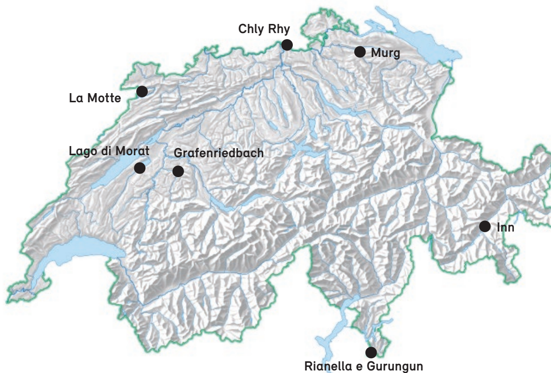
Ubicazione dei sette progetti di rivitalizzazione.

Trovate gli esempi qui riportati con le foto relative ai progetti, ulteriori informazioni e diverse opportunità di scambio sul tema rivitalizzazioni al sito www.plattform-renaturierung.ch/de/Thema/Revitalisierung .