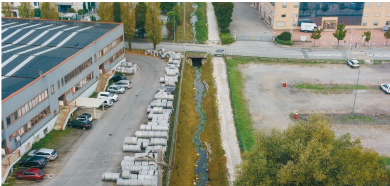
Da caso problematico a esempio da manuale: il ruscello Gurungun a Stabio.

Le rivitalizzazioni offrono vantaggi anche in paesaggi periurbani fortemente caratterizzati da edifici industriali. A dimostrarlo è un progetto di valorizzazione ecologica realizzato nel Mendrisiotto.