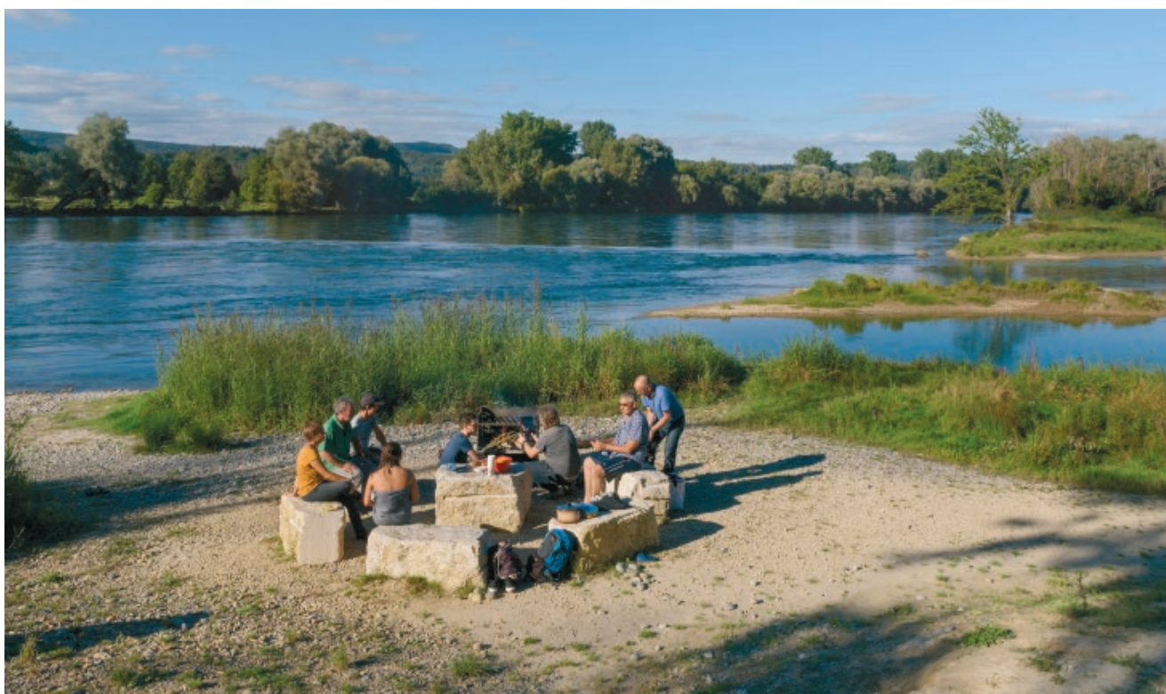
Dalla fine dei lavori di rivitalizzazione nel 2015, la golena del Chly Rhy è diventata una grande attrazione per gli escursionisti e gli amanti della natura.

Tuttavia, persino nel Cantone di Argovia, dove la popolazione dimostra una grande sensibilità nei confronti delle golene, l'opera di rivitalizzazione della golena del Chly Rhy rappresenta qualcosa di molto particolare. Infatti, è al centro di un'estesa riserva alluvionale protetta: qui, tra le altre cose, è stato riportato in vita un braccio laterale del Reno lungo 1,5 chilometri, un tempo bonificato, ed è stato creato un vero e proprio mosaico di habitat molto diversi tra loro.