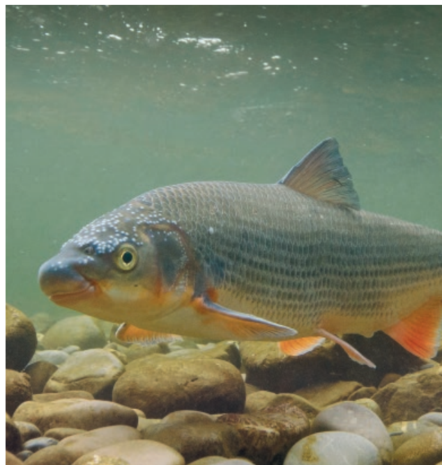
Nelle acque della Murg: un Naso con la livrea nuziale.

Nell'enorme padiglione all'ingresso dell'area, infine, le associazioni organizzano le loro feste, mentre il sabato mattina un gruppo di panettieri cuoce il pane in un forno a legna.