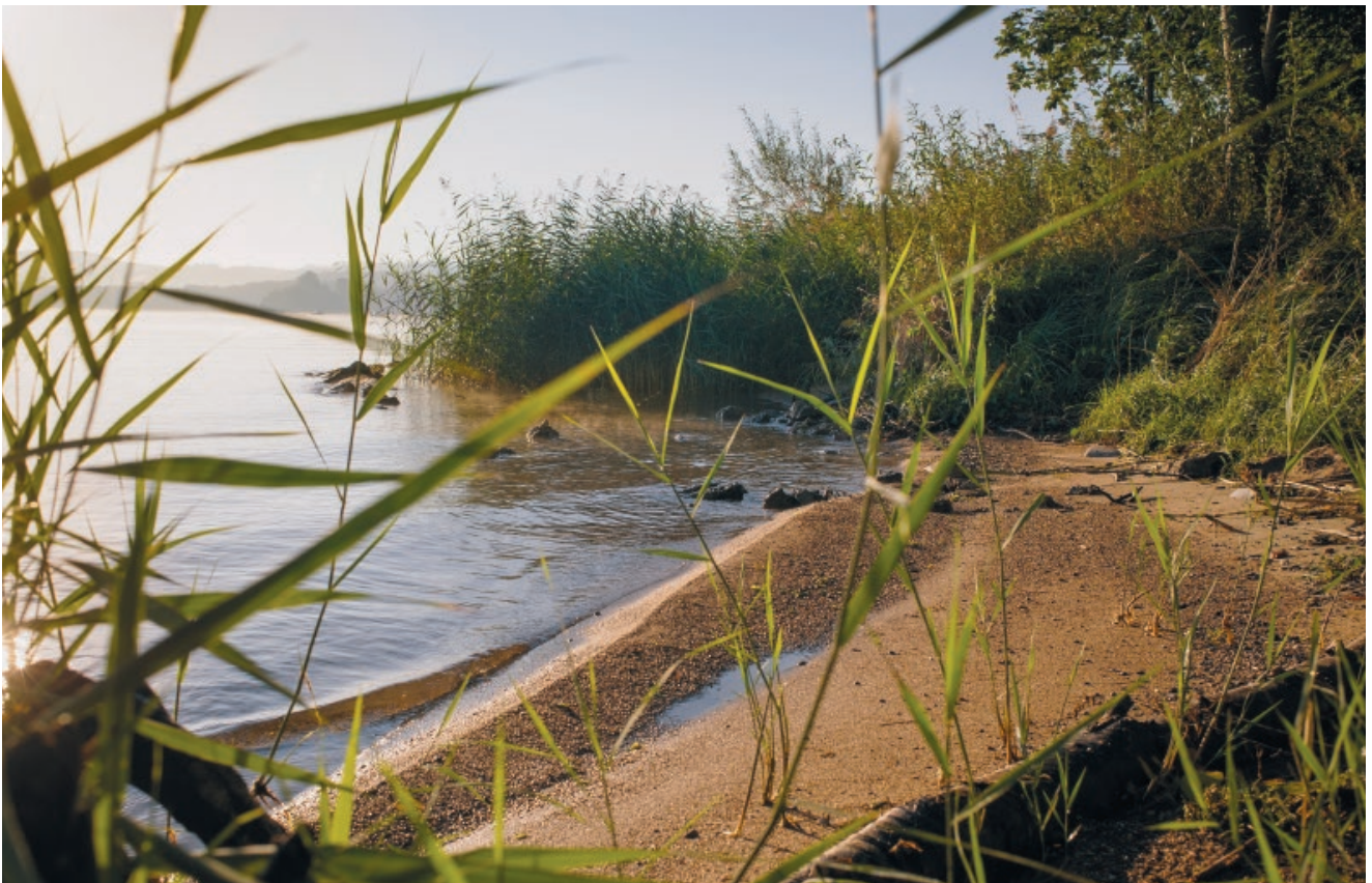
Lo smantellamento dei muri ha favorito la nascita di preziosi habitat lungo la riva.

Negli anni Sessanta il Canton Vaud dispose di spostare numerosi «chalet» costruiti direttamente in riva al lago, di alcune centinaia di metri lontano dall'acqua e di risi-