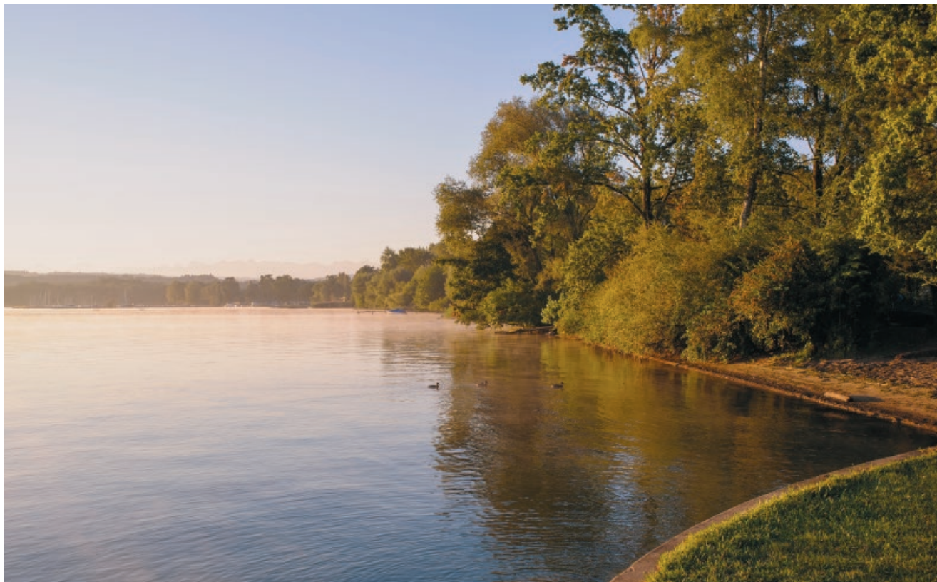
Le sponde rivitalizzate del lato sud-ovest del lago di Morat e la terrazza, risparmiata dai lavori di smantellamento, sempre e volentieri affollata da chi è in cerca di svago.

stemarli in una zona boschiva. Le terrazze sostenute da opere murarie, sulle quali erano stati originariamente eretti gli chalet, vennero invece lasciate sul posto.