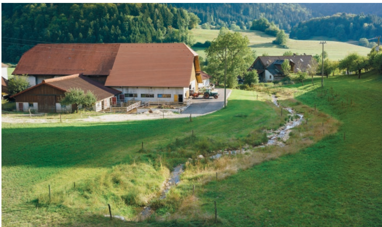
Con un minimo spostamento della Motte, la nuova strada d'accesso alla stalla si è venuta a trovare al di fuori dello spazio riservato alle acque. Il progetto edilizio ha così potuto prendere avvio.

Luoghi di ritiro e di riposo come questi, d'importanza vitale per i pesci, sono diventati particolarmente rari lungo il Doubs. Questo vale soprattutto per i suoi affluenti, come la Motte. Tali corsi d'acqua vengono sfruttati da sempre – tra le altre cose per far funzionare i mulini – e sono pieni di ostacoli. A risentirne in modo particolare è stata soprattutto la libertà di movimento dei pesci. Uno degli obiettivi delle misure di rivitalizzazione, perciò, è stato di consentire ai pesci di risalire la Motte per raggiungere i loro fregolatoi: una migrazione in uno spazio estremamente ridotto.