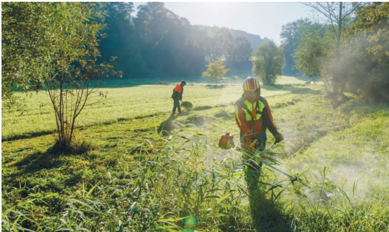
L'approccio adottato a Köniz ha contribuito a far sì che gli agricoltori dimostrassero più interesse e comprensione per i progetti ecologici nei corsi d'acqua.

Occorre essere prudenti anche quando si falciano i prati delle fasce cuscinetto. Queste ultime rappresentano un importante habitat per piccoli organismi, i quali non devono subire danni. Si falcia, perciò, a tappe, con intervalli di diverse settimane tra un intervento e l'altro, e a un'altezza non inferiore a 5 cm.