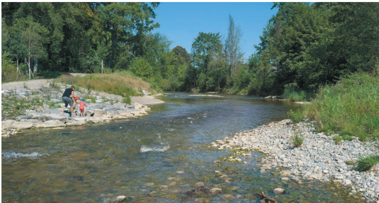
In primavera banchi di Nasi risalgono la Murg, in estate le famiglie si rilassano lungo le rive del fiume.

A Frauenfeld, e più esattamente nelle golene della Murg, un'opera di rivitalizzazione ha consentito la nascita di uno spazio ricreativo nel cuore della città. L'area viene sfruttata dalla popolazione in svariati modi e offre nuovi habitat per i pesci.